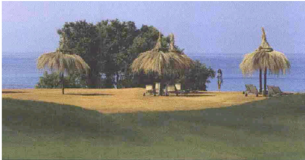
A sinistra, il Verdura Golf&Spa Resort di Sciacca (Ag). In basso, il ministro per il Turismo Michela Vittoria Brambilla